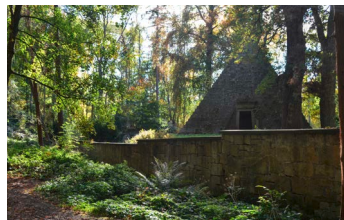
Laves Kulturpfad Derneburg