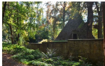
Laves Kulturpfad Derneburg